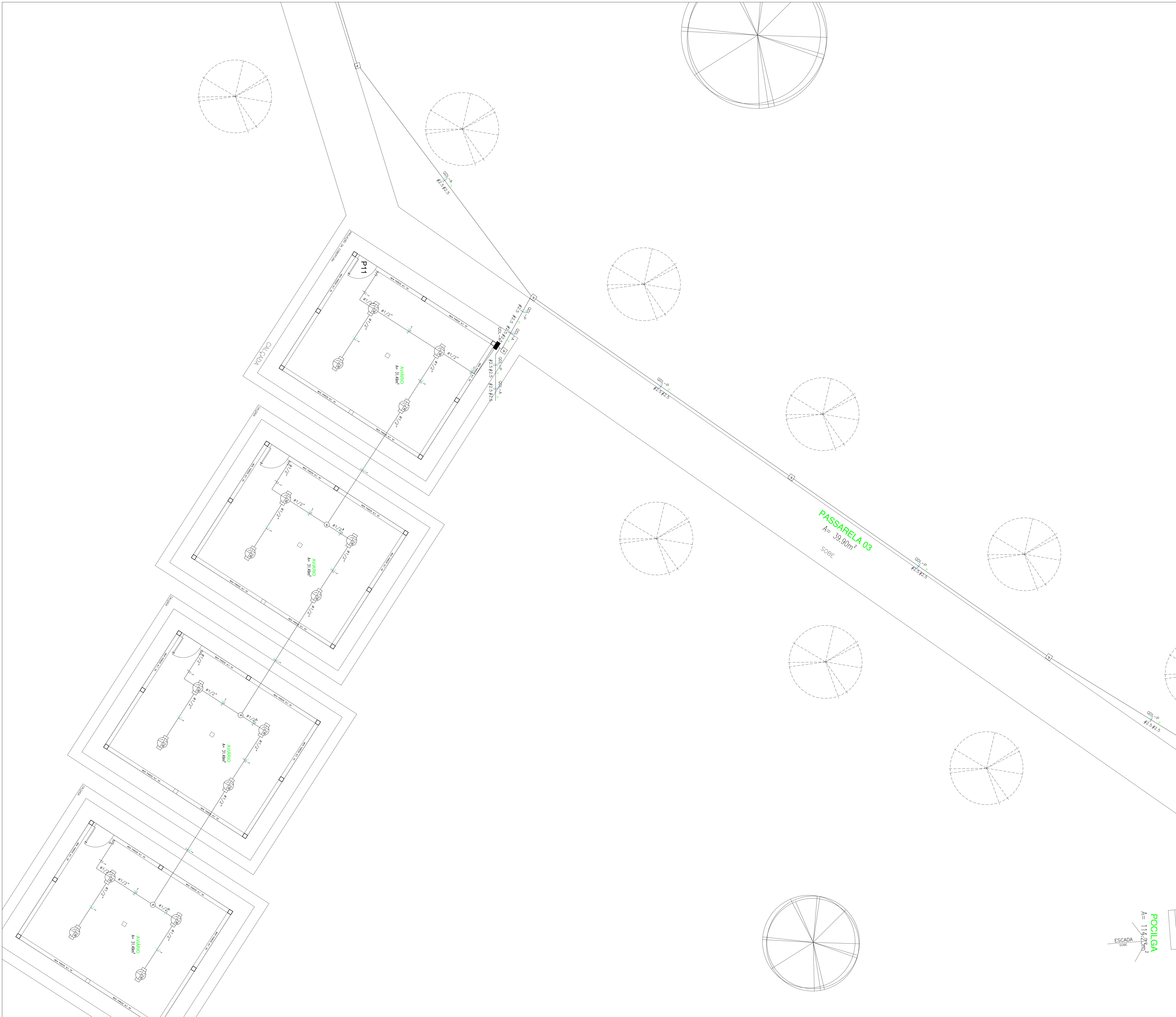
INSTALAÇÕES ELÉTRICAS ESCALA 1/50